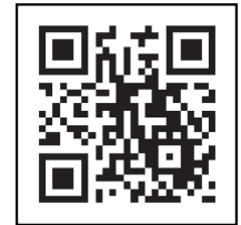
「コロナワクチンナビ」 二次元コード